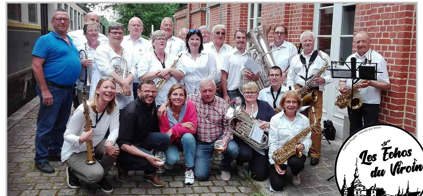
La Fanfare Royale «LES ÉCHOS DU VIROIN» lors de l'enregistrement de l'émission «LES AMBASSADEURS» à VIERVES, en septembre 2019

De son côté, la Fanfare Royale de VIERVES, qui a célébré 130 ans d'existence en 2017, possède sa propre salle dans laquelle elle peut organiser répétitions et concerts.