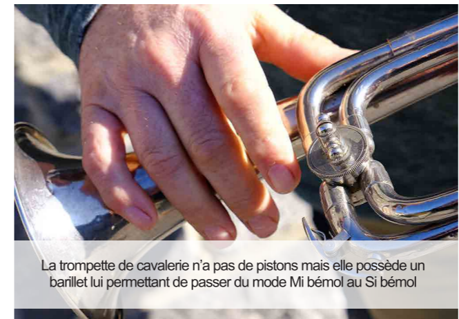
La trompette de cavalerie n'a pas de pistons mais elle possède un barillet lui permettant de passer du mode Mi bémol au Si bémol

Depuis quelques années on a la chance d'avoir parmi nous des jeunes qui s'intéressent à la musique et au groupe. Une chance aussi de pouvoir compter sur eux pour perpétuer la tradition.